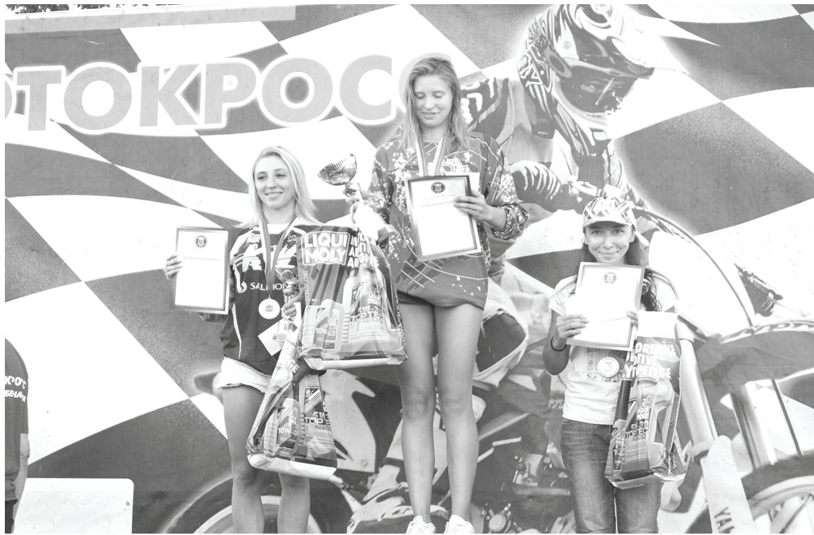
Женский пьедестал почёта.