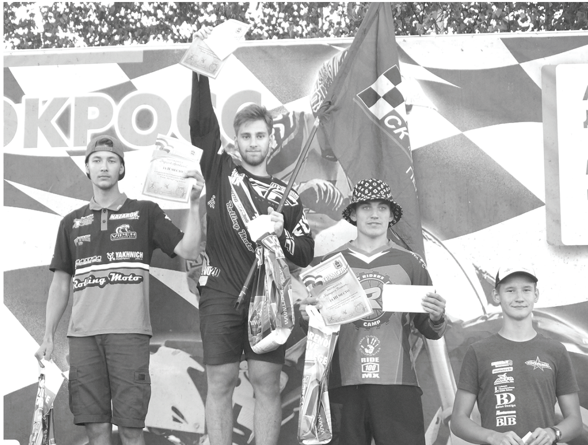
Призеры в классе 125 куб.см