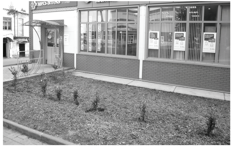
До рейда клумба была заросшей. Сейчас, по крайней мере, аккуратно. А если побольше цветочков посадить — вообще красота будет.

В начале августа рабочая группа в составе депутатов РСП, городской Думы, представителей мэрии, административной комиссии, отдела архитектуры и районной газеты прошла по центральным улицам п. Думиничи от здания администрации вниз к Большой Пролетарской и проверила соблюдение юридическими лицами и предпринимателями правил благоустройства территории, прилегающей к их магазинам, учреждениям и заведениям.