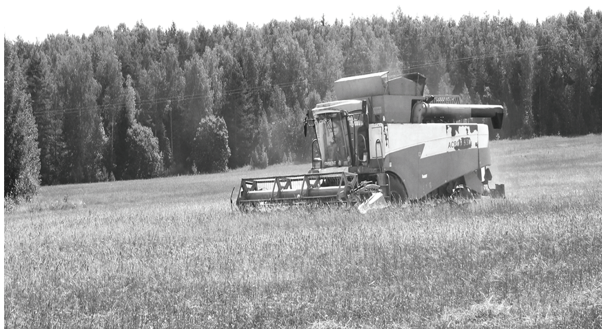
АПФ «Кадви»: уборка пшеницы на полях бывшего колхоза «Дружба», ранее не обрабатывавшихся более 8 лет.